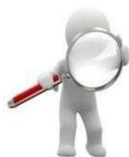
Tipos de Solicitudes