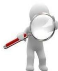
Tipos de Solicitudes